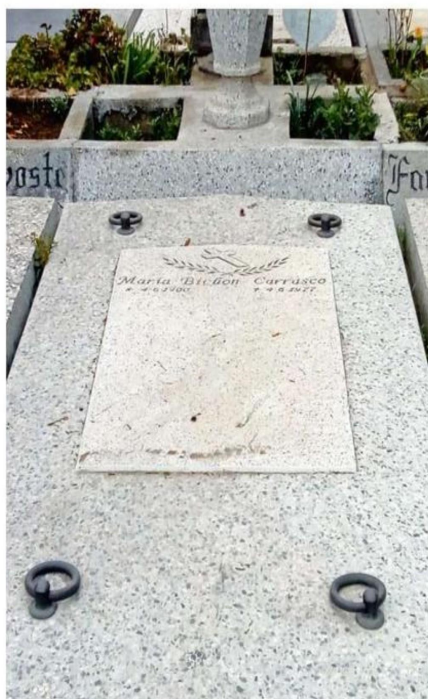
TUMBA MARÍA BICHON, CEMENTERIO METROPOLITANO, SANTIAGO.