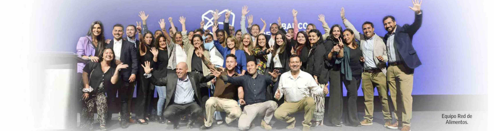
Equipo Red de Alimentos.