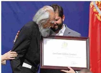
EN 2023 RECIBIÓ EL PREMIO NACIONAL DE HUMANIDADES.

Nicolás Cataldo, destacó en su discurso que Soublette era “un sabio necesario en los tiempos que vivimos, un inspirador que reúne distintas disciplinas con la autoridad que pocos tienen, un hombre de paz con una gran sensibilidad para vincular distintas culturas, religiones y cosmovisiones, lo que proyecta a distintos mundos y generaciones, para quienes ha sido una permanente inspiración”.