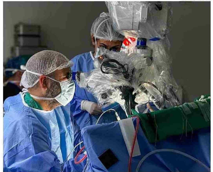
REALIZARON INNOVADORA CIRUGÍA PARA EXTIRPAR COMPLEJO TUMOR CEREBRAL.