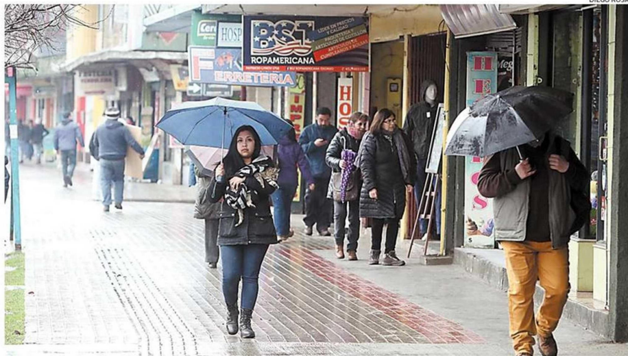
EL SECTOR COMERCIO, JUNTO A AGRICULTURA Y SERVICIOS SOCIALES, SON LOS QUE PAGAN LOS SUELDOS MÁS BAJOS.

Sobre las ocupaciones que con mayor frecuencia realizan las personas con los salarios más bajos, que no cuentan con calificación por su bajo nivel de escolaridad, figuran las aseso-