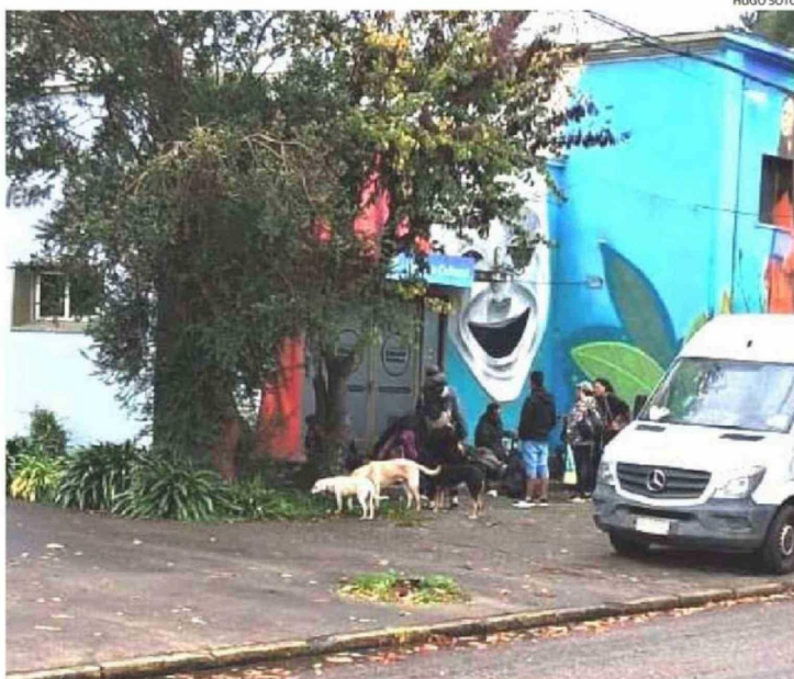
CASI UNA DECENA DE PERSONAS COMPARTEN CON SUS PERROS A LAS AFUERAS DE LA BIBLIOTECA Y CENTRO CULTURAL GALO SEPÚLVEDA, EN AVENIDA BALMACEDA, UNO DE LOS NUEVOS PUNTOS "OCUPADOS".

Las locatarias aseguran que utilizan esta infraestructura techada como casa ante la falta de albergues.