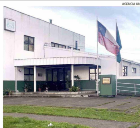
LA VÍCTIMA HIZO LA DENUNCIA EN CARABINEROS DE RAHUE ALTO.