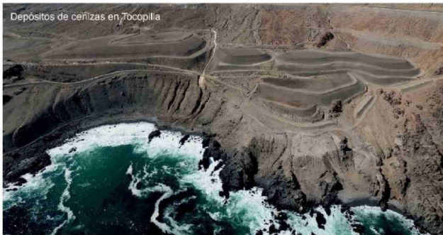
Depósitos de cenizas en Tocopilla

Las autoridades tampoco están fiscalizando, ni garantizando el cumplimiento de la ley, y la población local está heredando contaminación, desechos e impactos epidemiológicos.