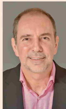
LOUIS DE GRANGE TRANSPORTES.