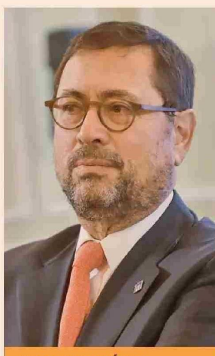
FRANCISCO PÉREZ MACKENNA CANCELLERÍA.