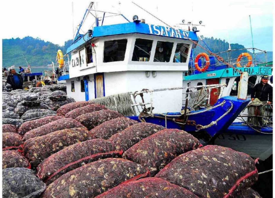
EN LA INDUSTRIA DEL CHORITO NO ADVIERTEN PROBLEMA MAYOR, PERO DE TODOS MODOS LLAMAN A GENERAR MEDIDAS CON TIEMPO.