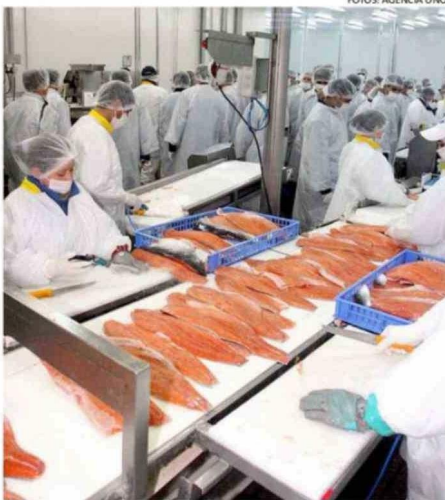
TANTO EN SALMONCHILE COMO EN EL CONSEJO DEL SALMÓN ANALIZAN LAS MEDIDAS A IMPLEMENTAR EN UN FUTURO CERCANO.