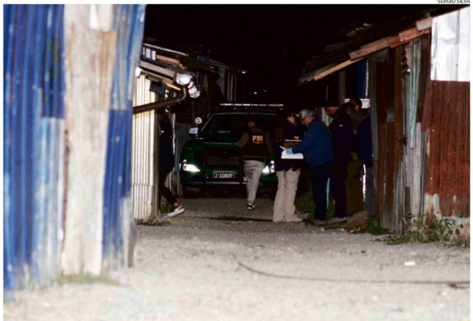
EL PLAN DE INTERVENCIÓN EN BARRIOS CRÍTICOS CONSIDERA ACCIONES MÁS RADICALES LIDERADAS POR LAS POLICÍAS, FISCALÍA, ENTRE OTROS ENTES.

OSORNO. Se trata de una iniciativa impulsada por el Ministerio de Vivienda que considera a Rahue Alto, donde se han identificado tomas y viviendas que son usadas por narcotraficantes. Se agrega la recuperación de áreas verdes y construcción de viviendas sociales. Las acciones más complejas serán durante el primer semestre. Alcalde aún no es informado, pero está dispuesto a ayudar.