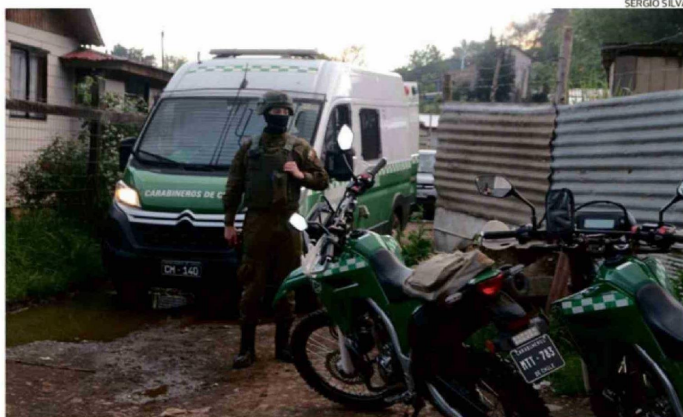
ENTRE LAS INTERVENCIONES SE INCLUYE UN MAYOR RESGUARDO POLICIAL EN LAS ÁREAS MÁS COMPLEJAS.

surgieron en el llamado "estallido social" de 2019, de las cuales el plan considera la intervención integral sólo de dos ubicadas en Rahue Alto, incluyendo la temida "Folilche".