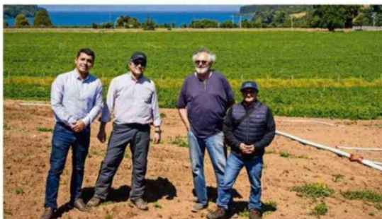
En el cultivo de papas donde se implementó la tecnología, se logró una alta uniformidad en el calibre del tubérculo.

La iniciativa, ejecutada por Procesadora de Plásticos Puelche y cofinanciada por Corfo Los Lagos, valida en terreno una solución tecnológica que reutiliza desechos plásticos para mejorar la eficiencia hídrica y la productividad agrícola en la comuna de Llanquihue.