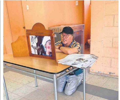
LA ACTIVIDAD BUSCA INCENTIVAR LA LECTURA.

Por su parte Hotuiti Teao (Evópoli) comentó que "no es aceptable que aparezcan nombres vinculados a gestiones fallidas y escándalos graves en procesos que definen el futuro de la educación pública".