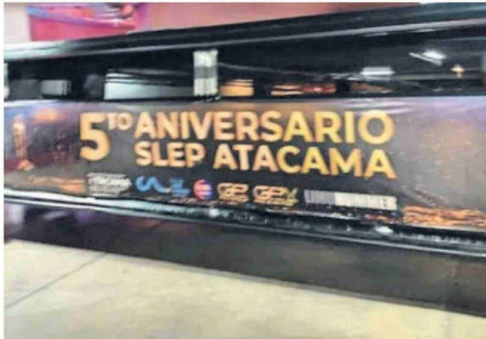
LA LIMUSINA HUMMER SE VOLVIÓ UN ÍCONO DE LA MALA ADMINISTRACIÓN DEL SLEP ATACAMA EN SUS 5 AÑOS.

En la misma línea, la diputada electa Paula Olmos declaró que "los cargos públicos no son refugio para autoridades cuestionadas ni espacios para reubicaciones silenciosas" y agregó que cuando una gestión termina en medio de polémicas "no corresponde que esa misma persona vuelva a postular a un cargo similar en otra región". Afirmó que la educación pública "exige liderazgo intachable, criterio y respeto por las comunidades