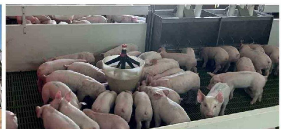
A DIFERENCIA DE LOS MODELOS TRADICIONALES, las instalaciones porcinas modernas en Chile reducen las emisiones de gases de efecto invernadero en un ciclo de economía circular que también incluye la recuperación de agua para riego tecnificado.