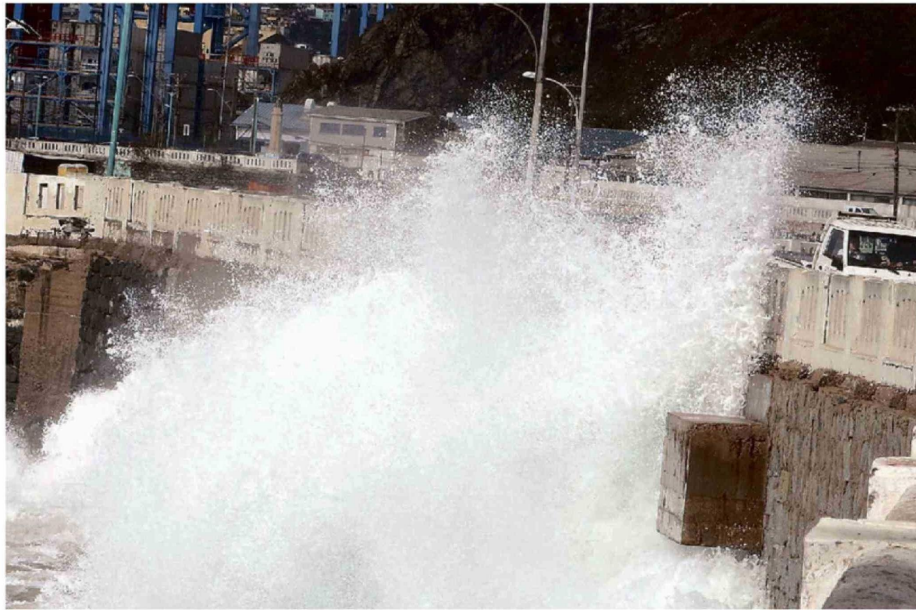
LOS RÍOS ATMOSFÉRICOS, POTENCIADOS POR EL CAMBIO CLIMÁTICO, MANTIENEN LATENTE RIESGO DE INUNDACIONES Y DESBORDES.

enero e integra a instituciones públicas, privadas y a la comunidad para fortalecer la prevención y la preparación frente a emergencias. ¿Su objetivo? "Reducir los riesgos asociados a las lluvias, nevadas y otros eventos meteorológicos del periodo otoño-invierno".