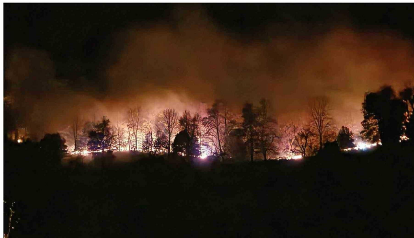
EL INCENDIO EN RUCÚE ha consumido cerca de 486 hectáreas y mantiene bajo vigilancia sectores habitados de Antuco.

zona siguieron atentos el avance del incendio y la presencia de humo visible desde distintos puntos de la comuna, mientras los equipos técnicos monitoreaban posibles cambios en la dirección del fuego.