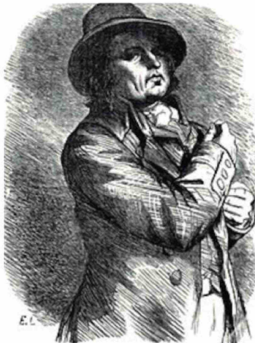
Charles Henri Sanson provenía de una generación de verdugos.

Una semana después, el decreto del presidente Lebron puso punto final a las ejecuciones públicas, pero no terminó con la pena capital ni con el uso de la guillotina, desde entonces confinada a los patios interiores de las prisiones, donde solo se admitía la presencia de magistrados,