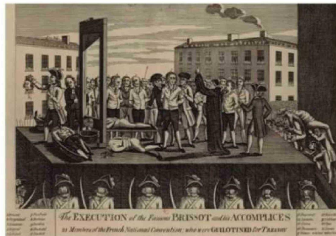
Una ejecución de 1794 de la guillotina, la maquinaria que prometía la muerte un un segundo y sin sufrimiento.