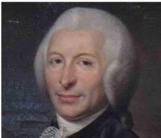
Joseph Ignace Guillotin, el médico que inventó la máquina letal.

Ese día debía ser ejecutado, como siempre antes del amanecer, Eugen Weidmann, un asesino de origen alemán con varias muertes en su haber. Sin embargo, un hecho fortuito hizo que cuando finalmente el reo fue llevado con las manos atadas y el pecho descubierto fuera de las puertas de la prisión de Saint-Pierre, en el centro de Versalles, donde estaba montado el cadalso, el sol ya estaba alto y había unas 600