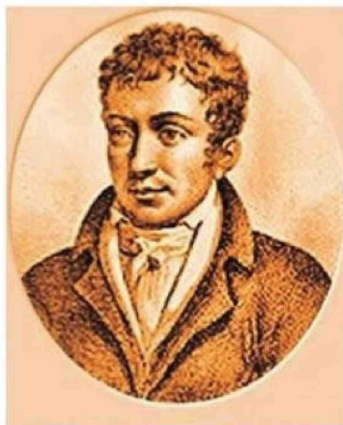
Retrato grabado de Nicolas Jacques Pelletier, el primer criminal ejecutado mediante la guillotina en Francia el 25 de abril de 1792.