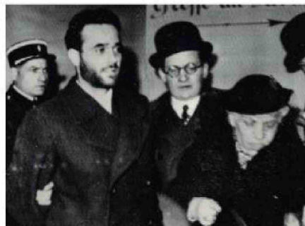
El asesino Eugen Weidmann / Eugene Weidmann con su madre en el tribunal. Fue la última persona ejecutada públicamente en Francia mediante la guillotina.