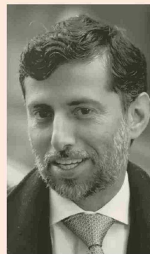
SUHAIL AL MAZROUEI MINISTRO DE ENERGÍA DE EUA

Conscientes de su importancia, tras el anuncio, el ministro de Energía, Suhail Al Mazrouei, destacó en declaraciones a Financial Times y CNBC que eligieron este difícil momento del suministro petrolero global para retirarse de la OPEP y la OPEP+ bajo la consideración de que la noticia tendría “un impacto mínimo en el precio” del crudo, teniendo presente las