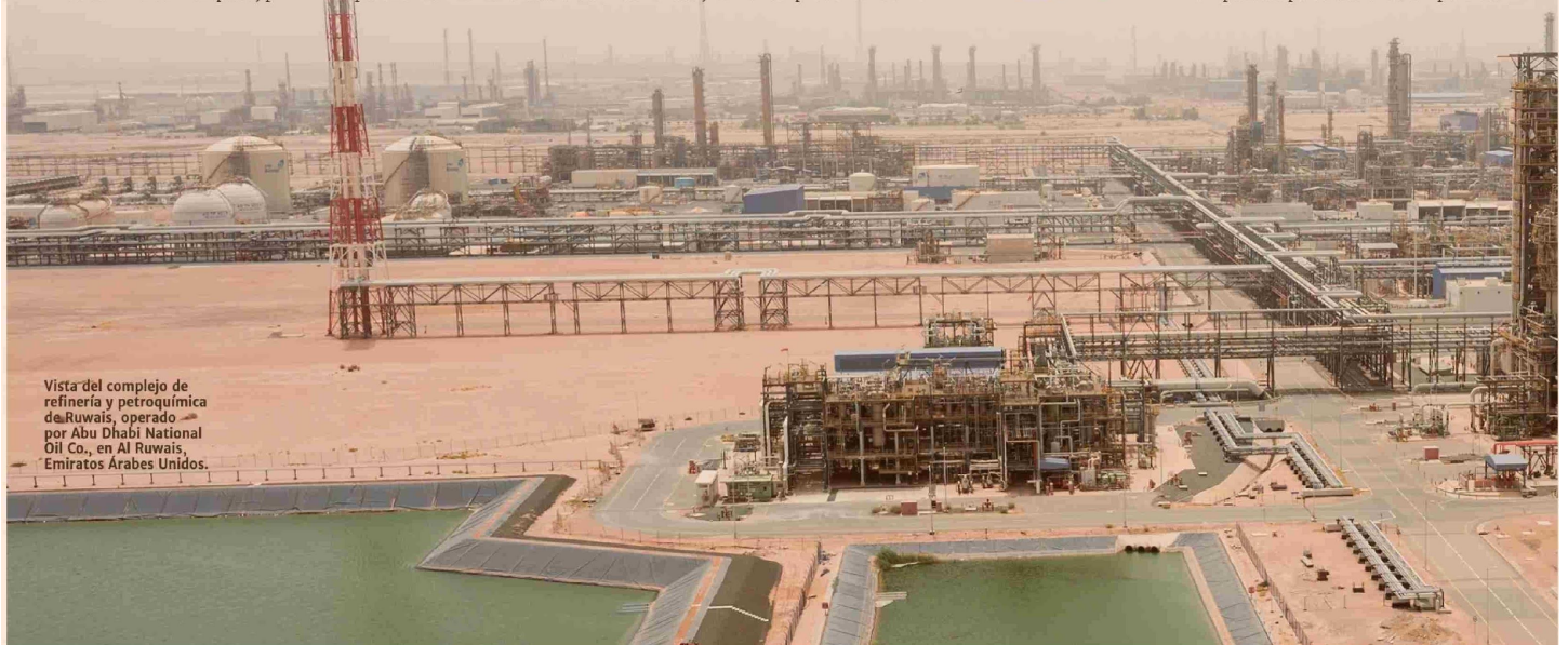
Vista del complejo de refinería y petroquímica de Ruwais, operado por Abu Dhabi National Oil Co., en Al Ruwais, Emiratos Árabes Unidos.

El experto detalla que “la OPEP+ ha demostrado que puede actuar con decisión, principalmente, en respuesta a perturbaciones temporales.