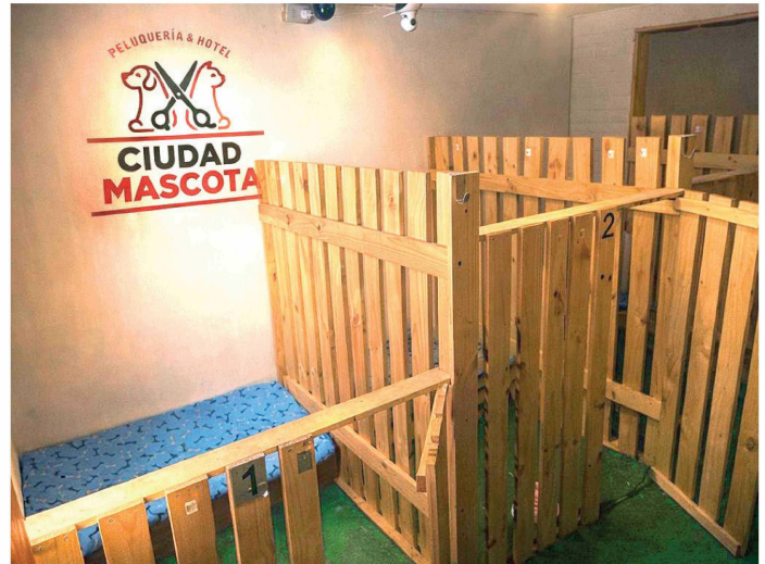
"Ciudad Mascota" dispone de tres cupos en box individuales. La idea a mediano plazo es aumentar a 6.