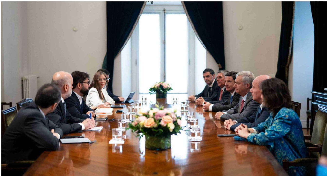
► Hoy existen al menos cuatro conflictos abiertos donde autoridades del gobierno de Gabriel Boric y futuros ministros de José Antonio Kast se enfrentaron públicamente.

Tiraje: 78.224 Lectoría: 253.149 Favorabilidad: No Definida