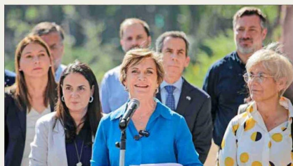
Evelyn Matthei, rodeada de sus 11 voceros de campaña.

A Matthei todavía le quedan materias pendientes para ordenar su candidatura, que no ha estado exenta de polémicas y debe "mantenerse vigente" hasta noviembre.