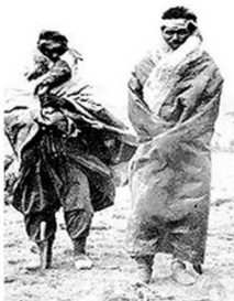
LOS TEHUELCHES SE CARACTERIZARON POR SU ALTURA, POR ELLO FUERON DENOMINADOS COMO PATAGONES POR LOS PRIMEROS EXPLORADORES EUROPEOS.

nizador que disminuyó fuertemente su población”.