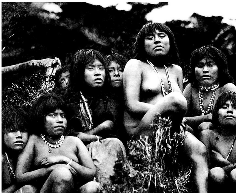
LOS YÁMANAS O YAGANES FUERON EL PUEBLO MÁS AUSTRAL DEL TERRITORIO NACIONAL. ACTUALMENTE EXISTE UNA COMUNIDAD EN LA ISLA NAVARINO.

Al respecto, el año 2017 la senadora Carolina Goic presentó un proyecto de ley ampliando las etnias que fueron eliminadas por dicho genocidio, señalando que los afectados fueron los pueblos selk'nam, aonikenk, yagán y kawésqar (alacalufes). En el texto afirmó: "Desde el año 1877 en adelante se produjo una destrucción acelerada y total de la etnia aonikenk y selk'nam, y la eliminación de prácticamente todos los pueblos canoeros de las regiones del extremo sur de