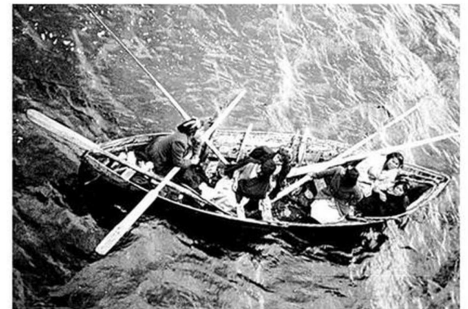
LOS KAWESKAR, MAL LLAMADOS ALACALUFES, RECORRIAN EN SUS FRÁGILES BALSAS LOS CANALES AUSTRALES.

El pueblo selk'nam u ona fue acosado y perseguido por los ganaderos de ganado ovino de Tierra del Fuego.