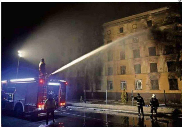
BOMBEROS UCRANIANOS EXTINGUEN UN FUEGO EN UN EDIFICIO ATACADO POR RUSIA.

sorprendió a todos al inicio de la noche del jueves cuando el presidente ruso había aceptado su posición ante los bombardeos a la capital ucraniana y las ciudades del país vecino, sea por una semana. Hace un frío recordamos muy contentos aparte de todo, lo último necesitan (los ucranianos) que les caigan misiles a las ciudades", expresó Trump. El presidente ruso confirmó ayer que se abstendrá de realizar ataques con el fin de crear condiciones favorables para la tregua energética. "Si Rusia no ataca nuestro sistema energético, ya sea a la capacidad de generación o a cualquier otro elemento, nosotros no atacaremos su sistema energético", dijo Zelenski. Millones de ucranianos han sufrido desde finales del pasado año constantes cortes de luz y calefacción de varios días debido a los ataques masivos rusos contra el sistema energético del país. Ucrania vive el invierno más crudo de los últimos lustros.