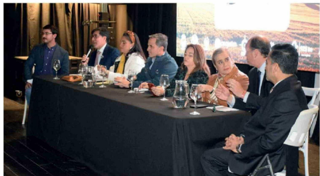
DURANTE LA JORNADA se abordaron medidas de prevención, coordinación institucional y desafíos para el mundo rural.