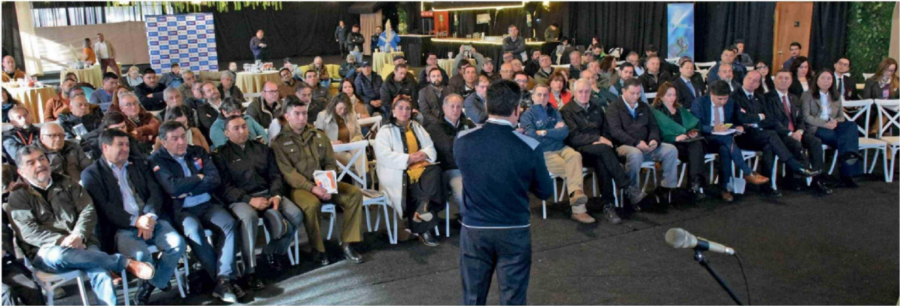
EL SEMINARIO "Desafíos de Seguridad para el Sector Rural del Biobío" congregó a autoridades y representantes del ámbito agrícola y de seguridad en dependencias de Socabio.