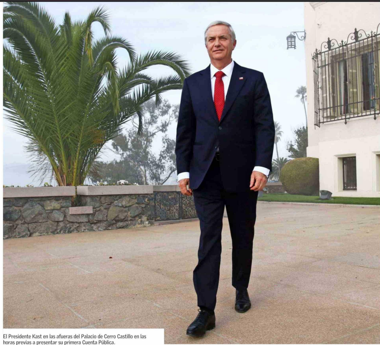
El Presidente Kast en las afueras del Palacio de Cerro Castillo en las horas previas a presentar su primera Cuenta Pública.

—Pongo como ejemplo el Banco del Estado. Cuánto tiempo se discutió por la comisión que cobraba por cada operación que se hacía a través de la cuenta RET. ¿Qué pasó? Se eliminó. Qué sucede con los municipios y el tema de los fármacos. Por cuánto tiempo la Cenabast le cobraba una comisión a los municipios. ¿Qué ha logrado el Minsal? Que esa comisión se le deje de cobrar a los municipios. Hoy está toda la disputa de los recortes, pero nadie dice que los municipios ya no tendrán que desembolsar 7 mil millones de peso solo por la comisión que les cobra la Cenabast. Y la ministra va munici-