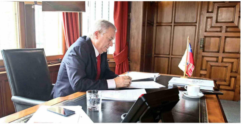
El mandatario en su oficina del Palacio Presidencial en Villa del Mar.

¿Lo que plantea es que podría evaluar indultos luego de diálogo con las fuerzas políticas? La facultad del indulto es del Presidente. Y yo he dicho que así como respeto las facultades del Congreso, el presidente hoy tiene facultades. Y mientras el Congreso no cambie esas facultades... Hoy hay toda una discusión por el traslado de 3 reses comunes (de Punta Peuco) a una cárcel común. Hay todo un debate sobre eso, pero yo no veo que se marque tendencia por el operativo que se hizo en la ex-Penitenciaría.