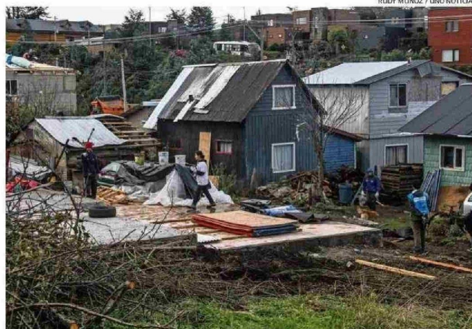
LA REMOCIÓN DE LOS ESCOMBROS AVANZA EN PUERTO VARAS. EL PANORAMA ES DESOLADOR.

Cerca de 30 funcionarios de esta cartera están calificados para esta evaluación, me-