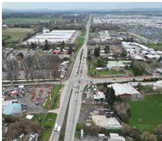
El gremio, junto con manifestar su preocupación por la falta de proyectos urbanos de alto impacto en la última década, ha levantado una serie de obras prioritarias en el ámbito vial. Entre ellas: la doble vía de Avenida Las Industrias.

La pandemia podría ser una causa, pero también tiene que ver con un tema económico del país, que está más lento, y eso es innegable. Eso hace también que los proyectos