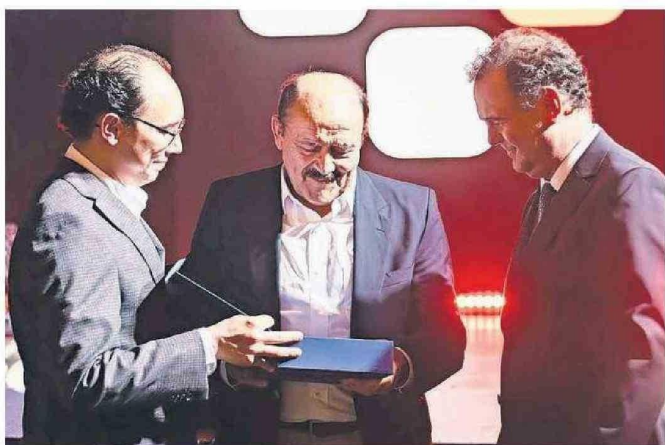
CON EMOCIÓN RECIBIÓ EL RECONOCIMIENTO, GRACIAS A LA VOTACIÓN DE SUS PARES DE LA MEDICINA.