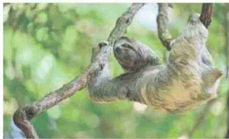
Perezoso de tres dedos en Costa Rica.