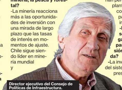
Director ejecutivo del Consejo de Políticas de Infraestructura.

-La minería reacciona más a las oportunidades de inversión con una mirada de largo plazo que las tasas de interés en momentos de ajuste. Chile sigue siendo líder en minería mundial y