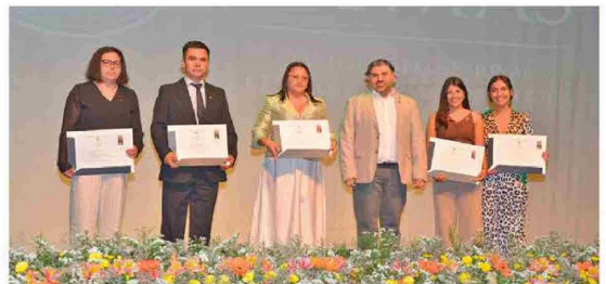
Casi mil titulados celebraron su egreso en ceremonias de titulación de Santo Tomás Rancagua en el Teatro Regional Lucho Gatica.

Familias, docentes y autoridades acompañaron a los nuevos técnicos y profesionales del IP y CFT en cinco ceremonias realizadas en el Teatro Regional Lucho Gatica, donde se reconoció el esfuerzo, la perseverancia y los valores.