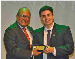
Premio Mejor Estudiante del Centro de Formación Técnica Santo Tomás Rancagua.