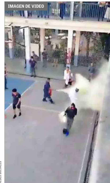
DISUASIÓN — Un auxiliar del liceo accionó un extintor contra uno de los manifestantes.