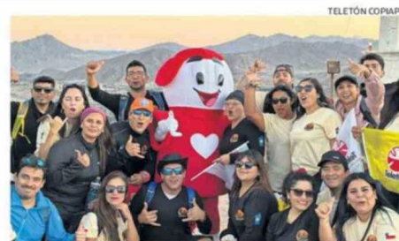
FUE UNA JORNADA MARCADA POR EL DEPORTE, LA INCLUSIÓN Y EL COMPANERISMO.