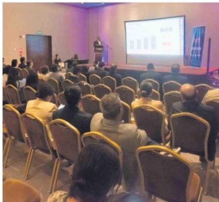
ASISTENTES DEL MUNDO PÚBLICO Y PRIVADO FUERON PARTE.

Kresse se refirió a un estudio encargado por la sanitaria Aguas del Altiplano, en el que se abordó la tendencia de crecimiento de la ciudad, comparando con otras que han enfrentado situaciones similares,