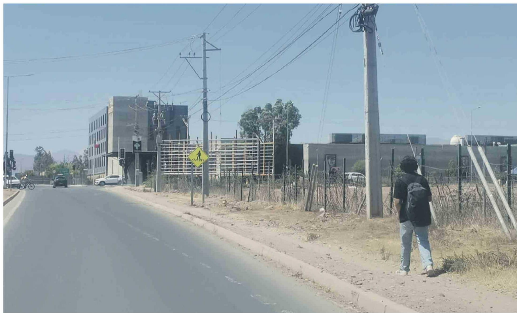
Vecinos de la parte alta transitan por el tramo entre el Hospital Provincial y el sector del casino para abordar buses interurbanos.

El cambio en los recorridos de buses interurbanos hacia La Serena ha generado un mayor tránsito peatonal entre el Hospital Provincial y el sector del casino, donde actualmente no existen veredas continuas. Vecinos advierten riesgos en horarios punta.