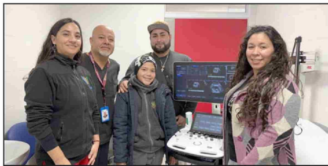
El hito se produjo en el recientemente inaugurado Cesfam de San Esteban.