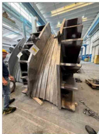
Justo por este inmensa canaleta debe correr el cable de 60 centímetros que soportará el tablero.

"Entonces -continúa el académico-, más que "absorber" movimientos como un amortiguador, estas piezas permiten que el puente pueda moverse y deformarse un poco sin generar daños o tensiones excesivas en los cables y conexiones".