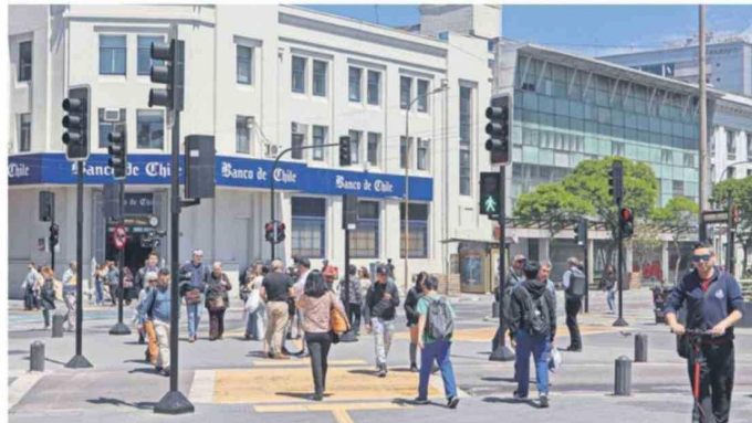
El mes termina con un alto registro de lluvias, pero se prevé que la temperaturas máximas sigan cálidas.

la meteoróloga. Pese a que en marzo estos eventos generaron un superávit de lluvias del 467% -lo normal son 22,2 mm-, "hablar de superávit de precipitación a estas alturas del año no representa el balance completo, porque estamos justamente en el comienzo de la temporada de lluvias, entonces todavía hay mucho que puede pasar", agregando que "el hecho que hayamos tenido un marzo lluvioso en el sur de Chile no necesariamente significa que el invierno vaya a ser igual".