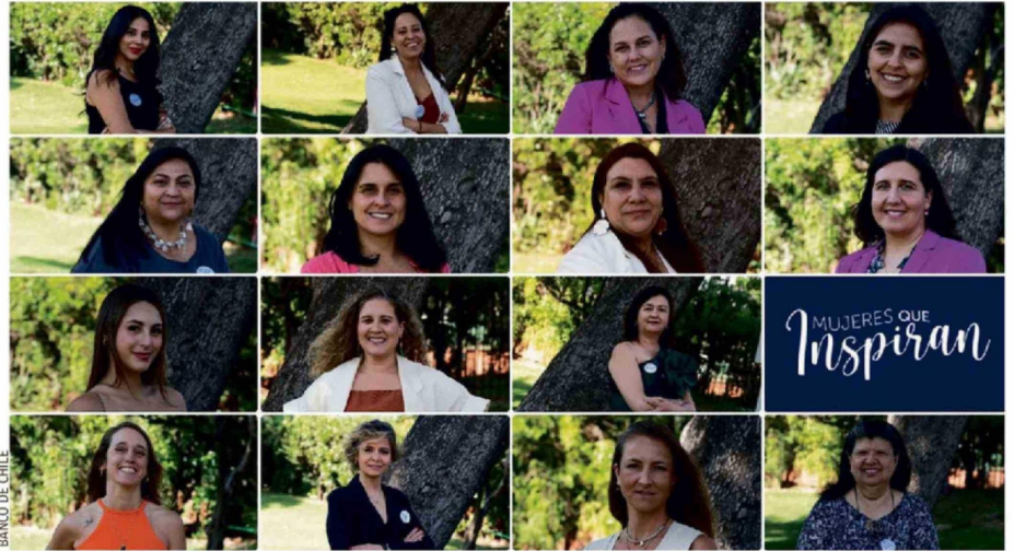
La edición 2025 de Mujeres que Inspiran cerró su convocatoria con un récord de 1.503 postulaciones de todo el país.

“En Banco de Chile estamos convencidos del impacto decisivo que tienen las mujeres en el desarrollo sostenible de nuestra sociedad. A través de la sexta edición de Mujeres que Inspiran, buscamos promover, apoyar y destacar a quienes están impactando su entorno y aportando, desde su trayectoria personal y laboral,