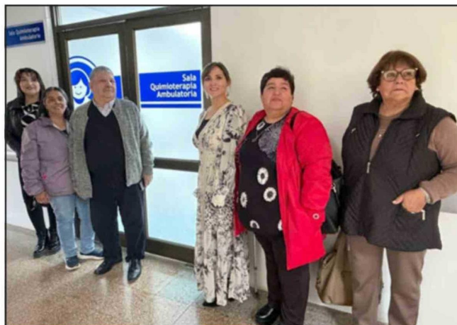
Autoridades y dirigentes vecinales visitaron el espacio de salud.