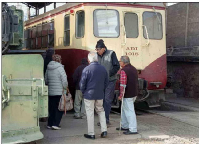
Locomotoras y equipos ferroviarios declarados Monumentos Nacionales podrán ser visitados gratuitamente por la comunidad en Los Andes.