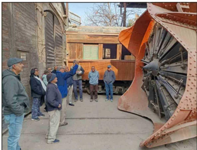
La jornada incluirá exposiciones fotográficas, trenes a escala, recreaciones históricas y relatos de antiguos trabajadores del Trasandino.

que resaltarlo porque el ferrocarril, para los que fuimos trabajadores, no ha muerto y sigue en nuestros recuerdos», concluyó.