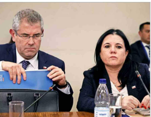
En virtud de las ausencias del Ministerio de Seguridad, la sesión se extendió por solo 20 minutos de las dos horas que inicialmente tenía programadas.

En esa línea, el legislador sostuvo que "hubiésemos podido tener la disposición de despachar este proyecto, pero sin la presencia del Ministerio de Seguridad es absolutamente imposible".