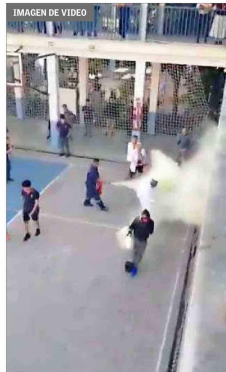
DISUSIÓN — Un auxiliar del liceo accionó un extintor contra uno de los manifestantes.