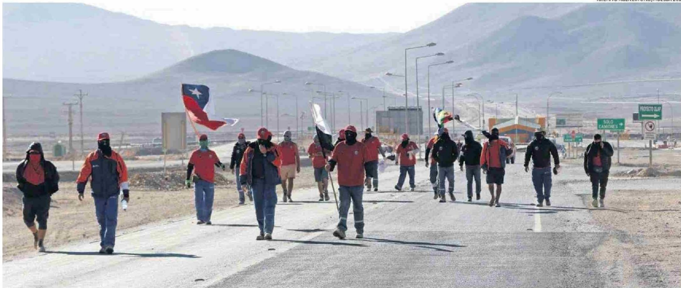
EN LA FOTOGRAFÍA LO QUE FUE LA HUELGA LEGAL DE TRABAJADORES DE MINERA ESCONDIDA EN EL 2017. SITUACIONES EN ESE PROCESO GATILLARON EN LO QUE AYER FALLO EL TRIBUNAL LABORAL.