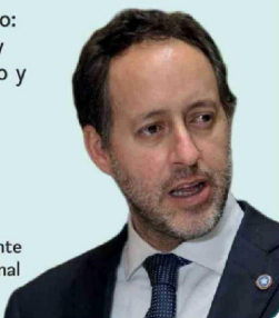
Cristóbal Urruticoechea, diputado del distrito 21, integrante de la bancada del Partido Nacional Libertario (PNL).

“Lo que pretende dar este proyecto es justamente eso: volver a tener estabilidad y credibilidad, formar empleo y bajar la cesantía”.