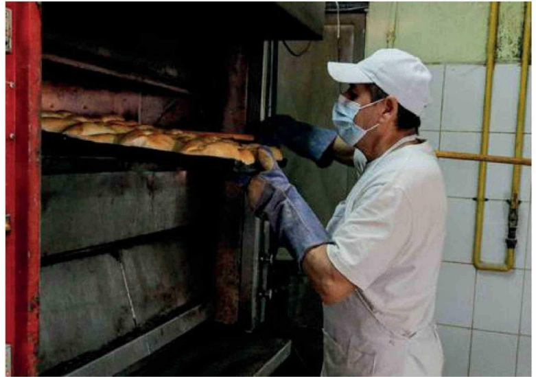
SECTOR DE PEQUEÑAS Y MEDIANAS EMPRESAS concentra una parte relevante del empleo formal y ha advertido efectos del proyecto en su carga tributaria futura.

Desde la entidad también señalaron que el escenario actual de las empresas de menor tamaño es complejo, con dificultades para sostener su operación y un contexto económico que no favorece su crecimiento, por lo que advirtieron que medidas de este tipo podrían profundizar esas condiciones.