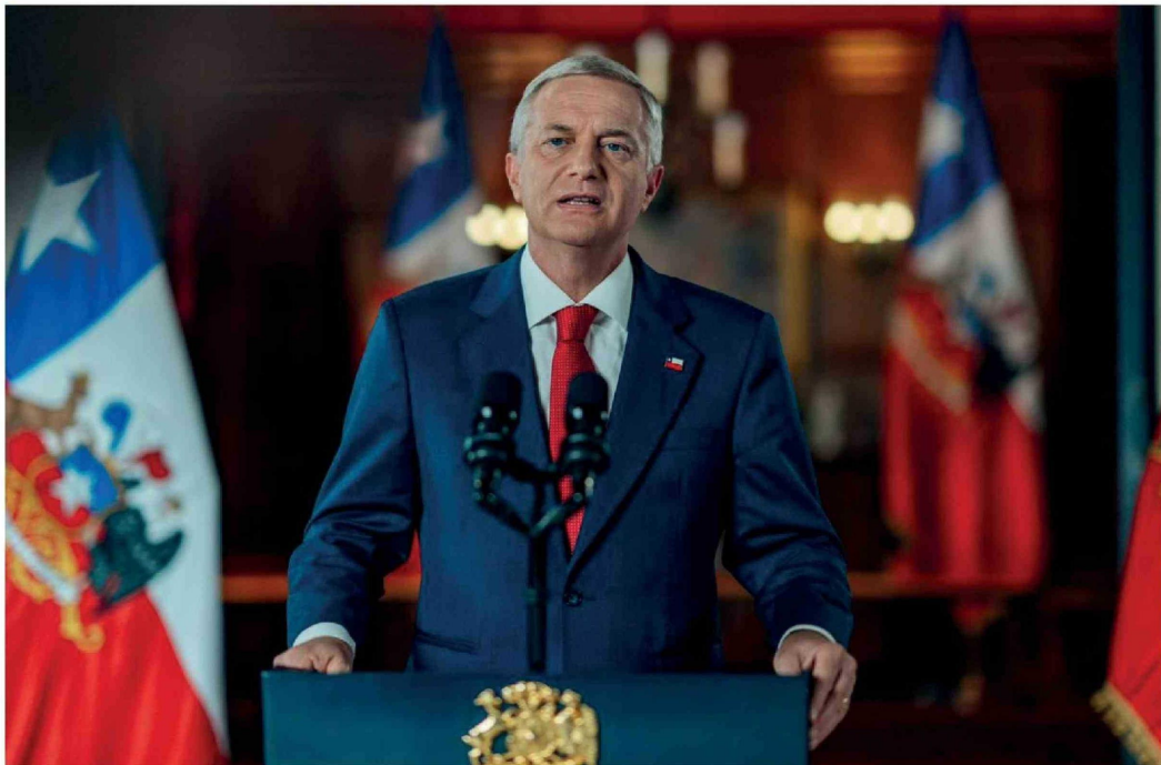
EL PRESIDENTE JOSÉ ANTONIO KAST durante la cadena nacional en que presentó la iniciativa, la que generó reacciones contrapuestas entre gremios empresariales y organizaciones de pymes.

La iniciativa generó reacciones divididas, con respaldo desde el sector productivo, mientras que desde el mundo de las pymes y algunos sectores políticos surgieron cuestionamientos a su diseño, especialmente en materia tributaria y su impacto en la recaudación.