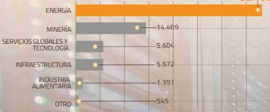
CARTERA DE INVESTCHILE POR SECTOR MONTO (EN MILLONES DE US$)