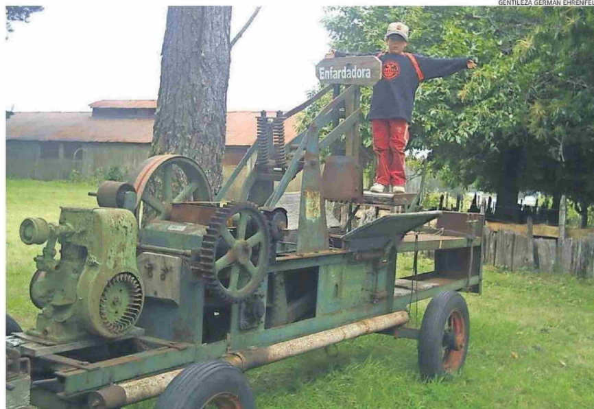
GRAN PARTE DE LAS MAQUINARIAS DE LA ISLA GUACAMAYO ESTÁN APTAS PARA SU FUNCIONAMIENTO.

“En los años ‘50 vivieron más de 100 personas en la isla, entre la familia, los empleados hijos y gente que trabajaba en las cosechas de temporada. Y como no había escuela, porque la úni-