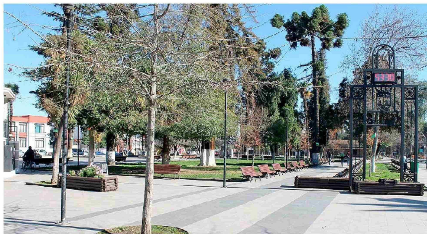
Rengo destaca en este estudio pasando de un nivel bajo a medio alto.