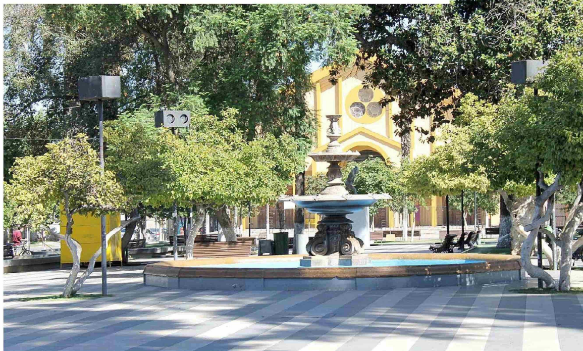
La Plaza de Armas de Rengo, una de las postales de la ciudad.