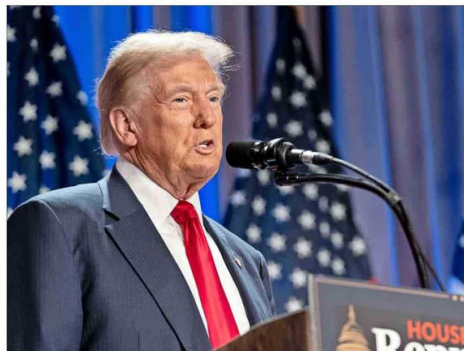
En el escenario político, el presidente electo de Estados Unidos, Donald Trump, y el gobierno de ese país son las principales fuentes de inquietud.

“Sabíamos que la elección de Donald Trump como presidente de Estados Unidos traería