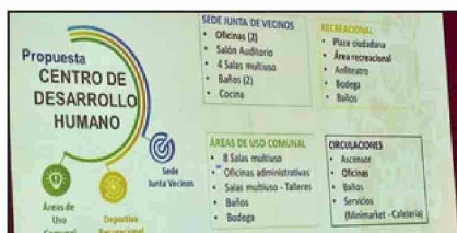
Más información de cómo deberían ser los dos proyectos.