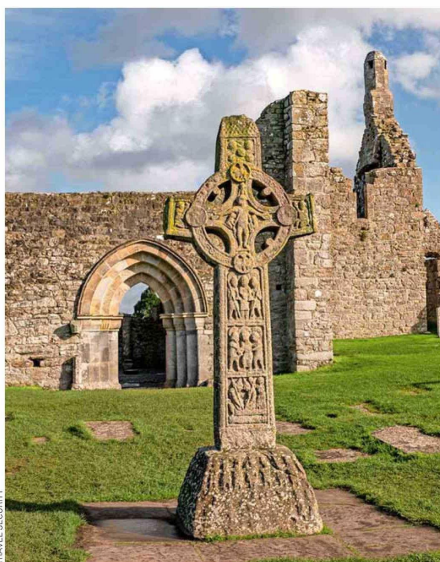
La distintiva cruz celta del Monasterio de Clonmacnoise, uno de los monasterios pioneros en la producción de whisky.

Conozca los Viajes de Colección de Travel Security.